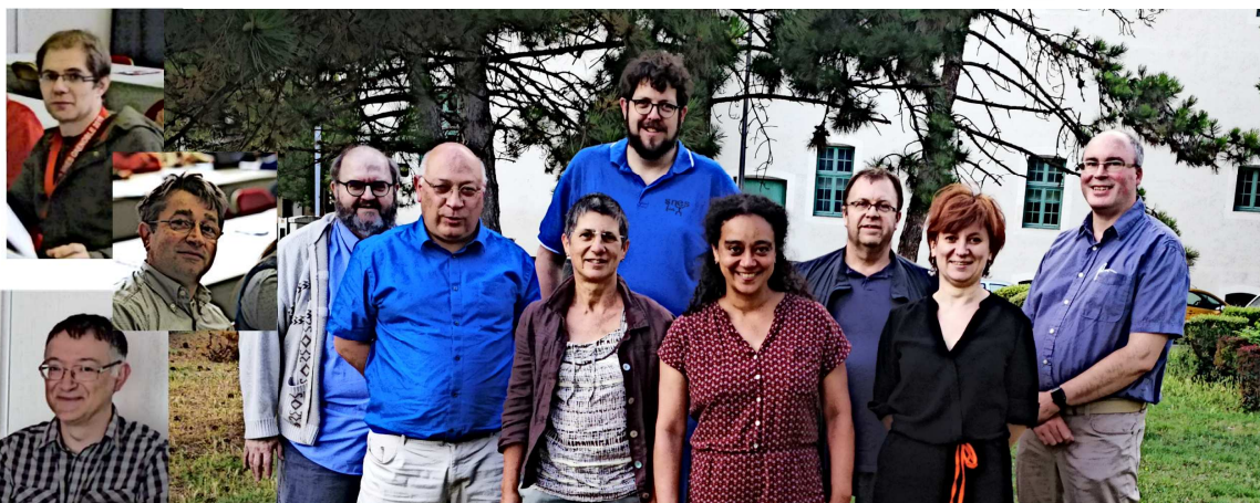
11 secrétaires académiques enthousiastes, élus par les syndiqués et au service de la profession.