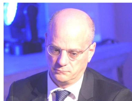
Gribouille toi-même ton Blanquer